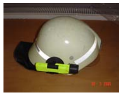
Helm mit Lampe