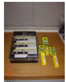
Todmannwarngerät mit Aussenüberwachungseinheit