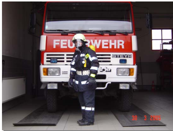
Gewicht der Ausrüstung ca. 26kg